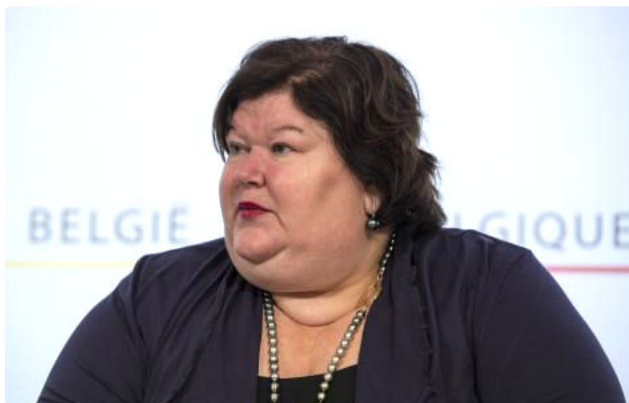
Maggie De Block, Ministre de la Santé

Lettre de Claude Brasseur à Maggie De Block, Ministre de la Santé.